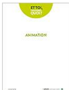
Et toi, t'en penses quoi? PDF