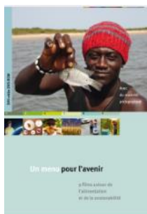
Un menu pour l'avenir DVD