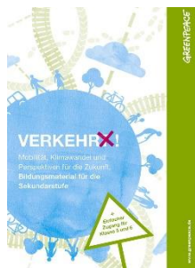
Verkehr(t)! Zyklus 2 und 3