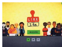
like2be – Welcher Job passt zu wem? Zyklus 3