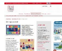
Challenge accepted! Zyklus 3 und Sek II