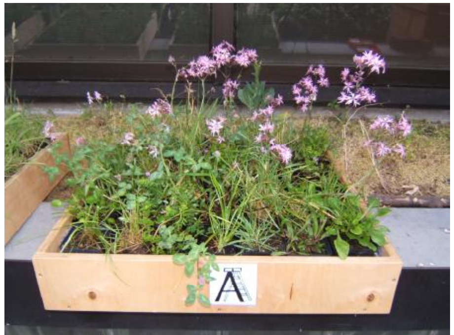
«Wiese» mit acht verschiedenen Pflanzenarten.

Wiese gefiel bzw. nicht gefiel. Zudem wurden weitere Aufgaben sowie Fragen rund um das Thema Pflanzen gestellt. Nach dem Pretest arbeitete die Hälfte der Kinder im Rahmen des MeNuK-Unterrichts ( M ensch, N atur und K ultur