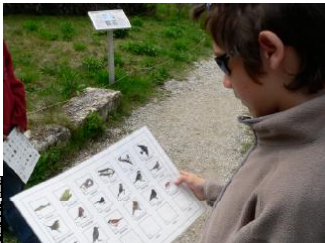
Vereinfachtes Inventar zur Biodiversität in La Sauge.

können. Als Beitrag dazu hat der SVS Unterrichtsmaterialien und ein Animationsangebot zur Biodiversität entwickelt, welches Gruppen (v.a. Schulklassen ab der 4. Primarschule) im Naturschutzzentrum La Sauge entdecken können (Dauer 2½ Stunden).