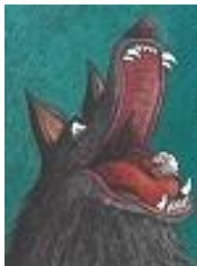
Das Lamm, das kein Schaf sein wollte 1. Zyklus