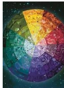
BNE-Kit «Plastikwelten» bis 3. Zyklus