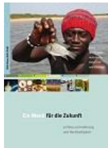
Ein Menü für die Zukunft alle Schulstufen