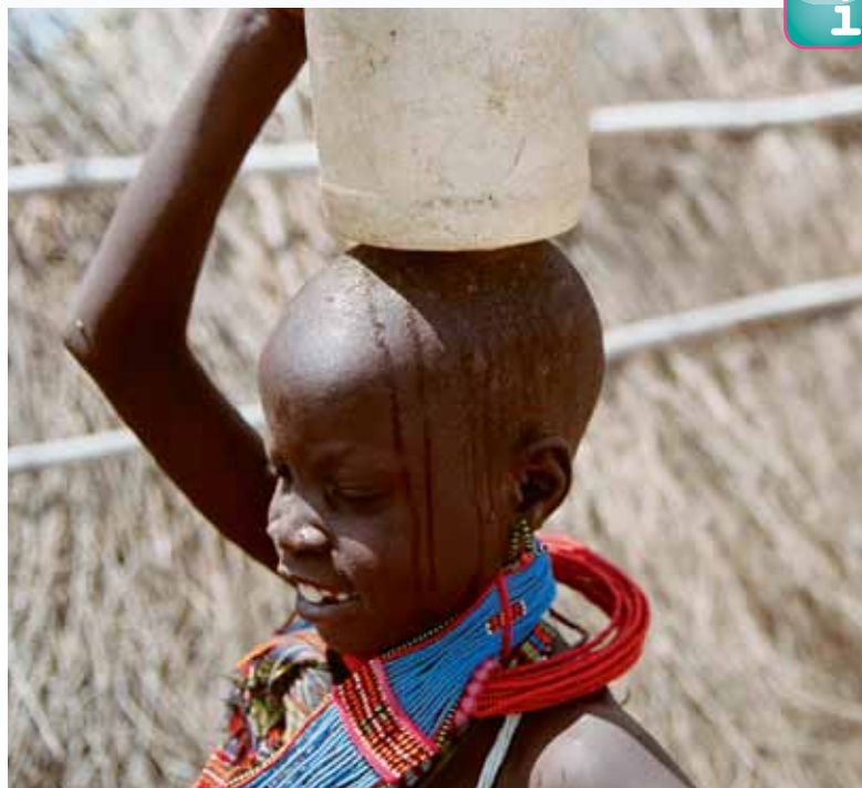
I bambini sanno che l'acqua potabile ha un ruolo importante nella salute.

Caritas Svizzera lavora da molti anni per migliorare l'approvvigionamento di acqua delle popolazioni sudanesi. Sono stati costruiti e sono conservati in buono stato oltre 200 pozzi a mano. Nel 2006 è stato costruito, in un villaggio, il primo ser-