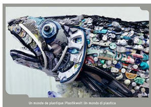
Un mondo di plastica Kit ESS III per tutti i cicli