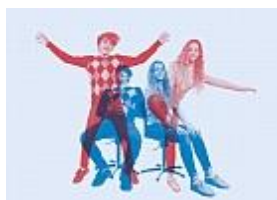
La scuola in movimento per tutti i cicli