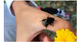
Un albergo per le api selvatiche Cicli 1 e 2