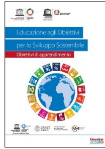
Educazione agli OSS Ciclo 3 e Sec II