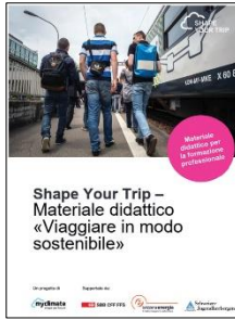
Shape Your Trip Secondario II