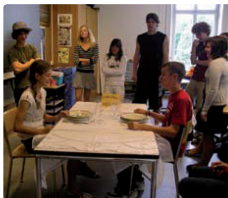
Sguardo sull'atelier didattico dedicato alle buone maniere a tavola

«In base alla nostra esperienza, è necessario affrontare il tema sull'arco di diversi mesi per fare in modo che la sostenibilità venga effettivamente integrata nella quotidianità scolastica.»