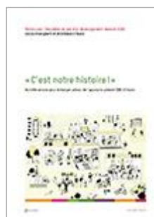
C'est notre histoire Tous les cycles