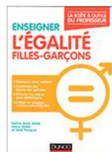
Enseigner l'égalité filles-garçons Tous les cycles