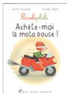
Achète-moi la moto rouge ! Cycle 1