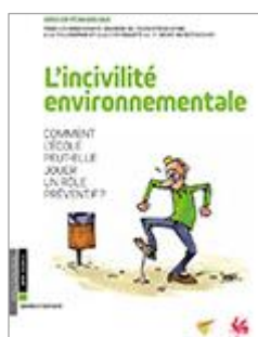
L'incivilité environnementale Cycle 3