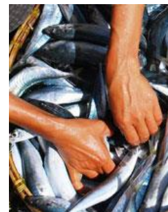
Jeu éducatif Le vivier Postobligatoire