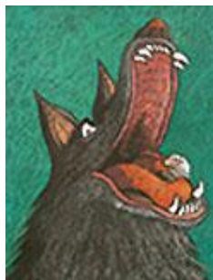
L'agneau qui ne voulait pas être un mouton Cycle 1