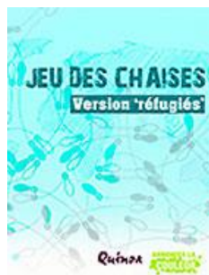
Jeu des chaises version «réfugiés» Cycle 3 et Postobligatoire