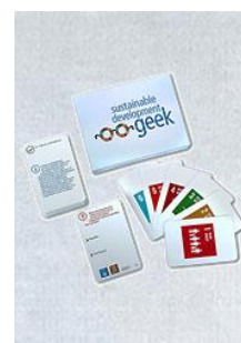
Sustainable development geek Postobligatoire