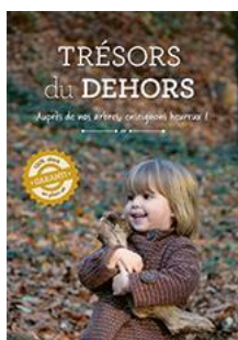
Trésors du dehors Cycles 1 et 2