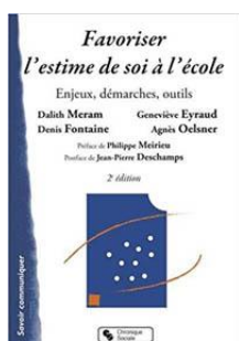
Favoriser l'estime de soi à l'école Cycle 1