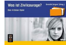
Was ist Zivilcourage? Spiel