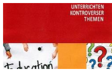
Unterrichten kontroverser Themen PDF