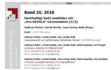
Nachhaltig(-keit) ausbilden 2 PDF