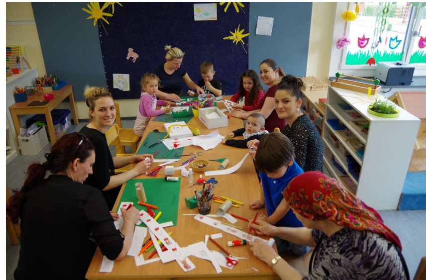
Deutsch vor KG