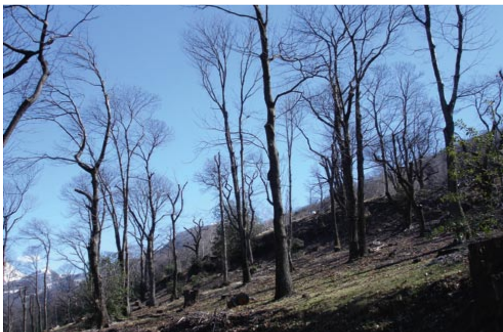
La selva castanile d'inverno

Alcune schede e una bibliografia specifica sono disponibili su www.globaleducation.ch