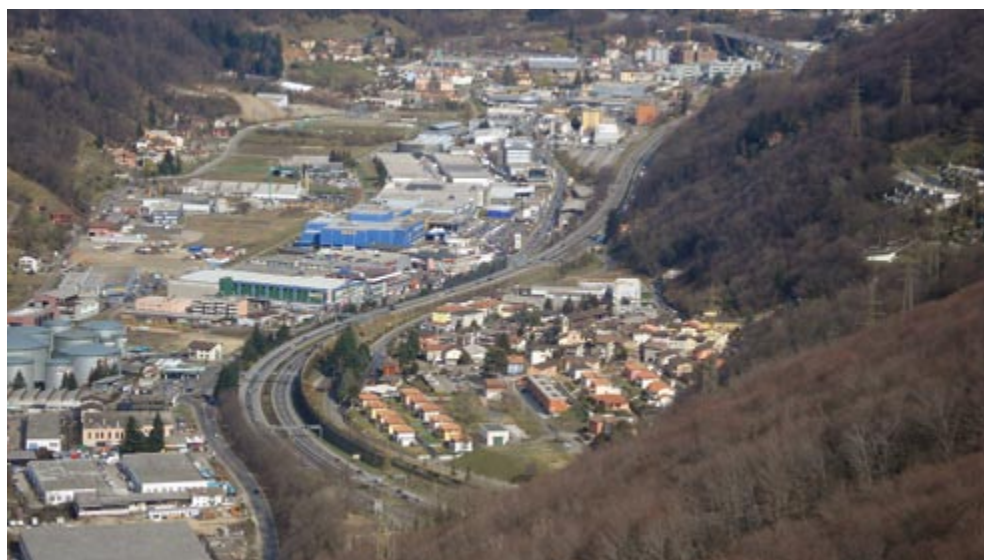
Pian Scairolo oggi