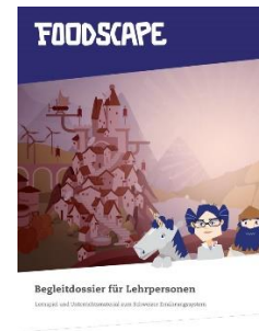
Foodscape Ab Zyklus 3