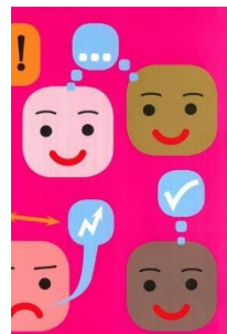
Demokratie! Ab Zyklus 2