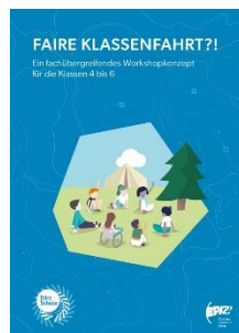
Faire Klassenfahrt?! Zyklus 2