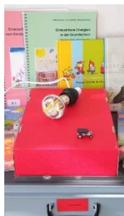
Medienkoffer Energie Zyklus 1 und 2