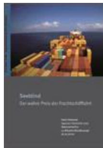
Seeblind DVD und PDF