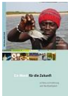
Ein Menü für die Zukunft DVD und PDF