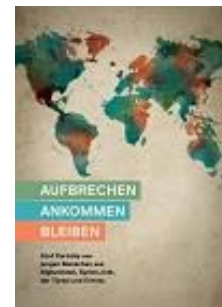
Aufbrechen, Ankommen, Bleiben PDF