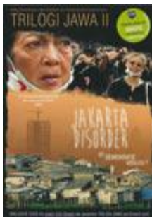
Jakarta Disorder. Ist Demokratie gerecht? DVD und PDF