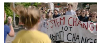
Plus chauds que le climat? 3. Zyklus + Sek II