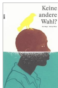
Keine andere Wahl? 3. Zyklus