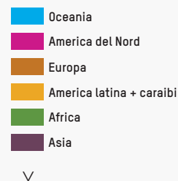
Ill. 2: Popolazione dei centri urbani

„Nel 1970 c'erano solo due città al mondo con più di 10'000'000 abitanti: Tokyo e New York“.