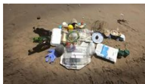
Chiripajas VOD | Ciclo 1

Le vostre riflessioni vanno in passeggiata