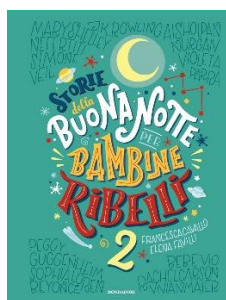
Buona notte per bambine ribelli 2 Ciclo 2 e 3