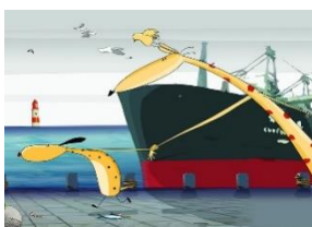
Una giraffa sotto la pioggia VOD | Ciclo 2