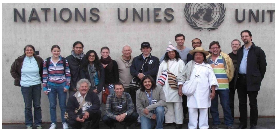
Incontro con gli Indiani Kogis (Colombia), visita dell'ONU con degli insegnanti e degli allievi