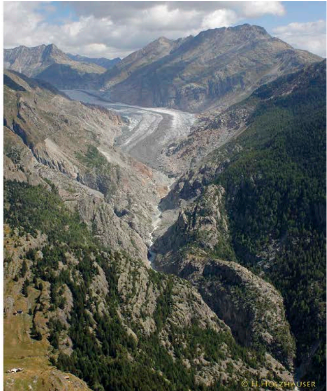
Abb. 2 Aletschgletscher 1856 und heute

Die Schnee- und Eismengen nehmen weltweit ab. Gletscher sind zeitlich verzögerte, aber zuverlässige Anzeiger von klimatischen Temperaturschwankungen: Fast überall auf der Welt sind Eismassen weiter abgeschmolzen und auf der Nordhemisphäre hat die Ausdehnung der Schneedeckung im Frühjahr abgenommen. 10 Das Gebiet der Arktis sowie alpine Regionen erwärmen sich zudem etwa doppelt so stark wie im globalen Mittel. 11