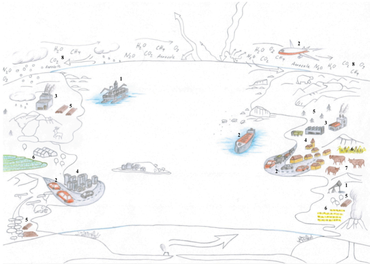
FIGURA 1: SISTEMA CLIMATICO NATURALE CON INFLUENZE ANTROPOGENICHE: CAUSE (FONTE: REALIZZAZIONE INTERNA AL PROGETTO CCESO II, DISEGNO DI MICHELLE WALZ 2019)

sono in gran parte usati come carburante nel traffico (2) e come combustibili e materiali derivati dal petrolio nell'industria (3), così come per il riscaldamento e il raffreddamento di edifici (4). Emissioni di gas a effetto serra sono pure generate dal disboscamento intensivo (5) e nell'agricoltura tramite la coltivazione di riso e l'allevamento (innanzitutto metano; 6 e 7).