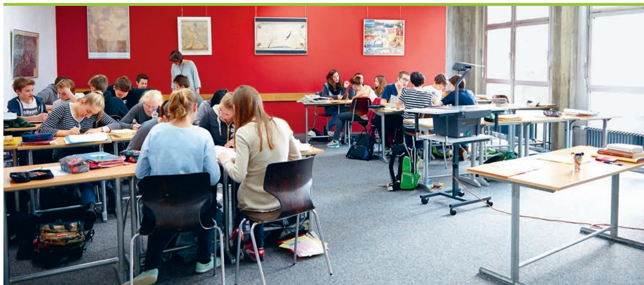
Classe de 9 e HarmoS de Mendrisio (TI)