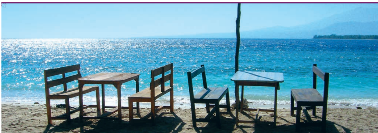
Poster « 1024 regards » – Pistes pour l'enseignement sur le thème du tourisme