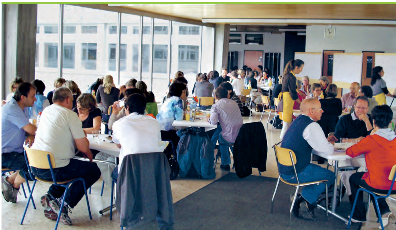
Cycle d'Orientation (CO) de Jolimont | Fribourg